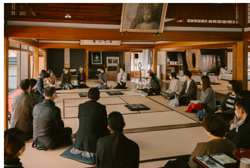
参加者との座談会の様子

第1回なでしこのマドイレポート： https://prtmes.jp/main/html/rd/p/000000005.000053858.html