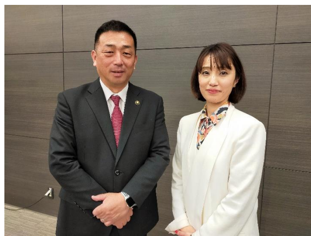
（左）橿原市長・亀田忠彦氏 （右）代表・高木麻衣

本セミナーは、同市の事業所の立地促進を目的とし、事業所の新設、増設、移設を検討している事業者を対象に、立地環境の魅力を紹介する講義を実施。橿原市長・亀田忠彦氏の新事業展開の案内をはじめ、奈良労働局 職業安定部や奈良県産業・観光・雇用振興部、橿原市 都市デザイン部が県や市の取り組みを発表しました。